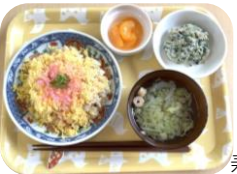
5月5日のメニューはちらし寿司を美味しくいただきました