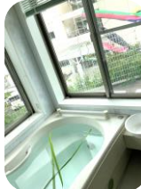
菖蒲湯にも入ったよ！